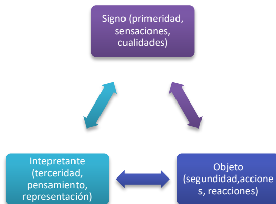
Cuadro N°2: El signo de Peirce